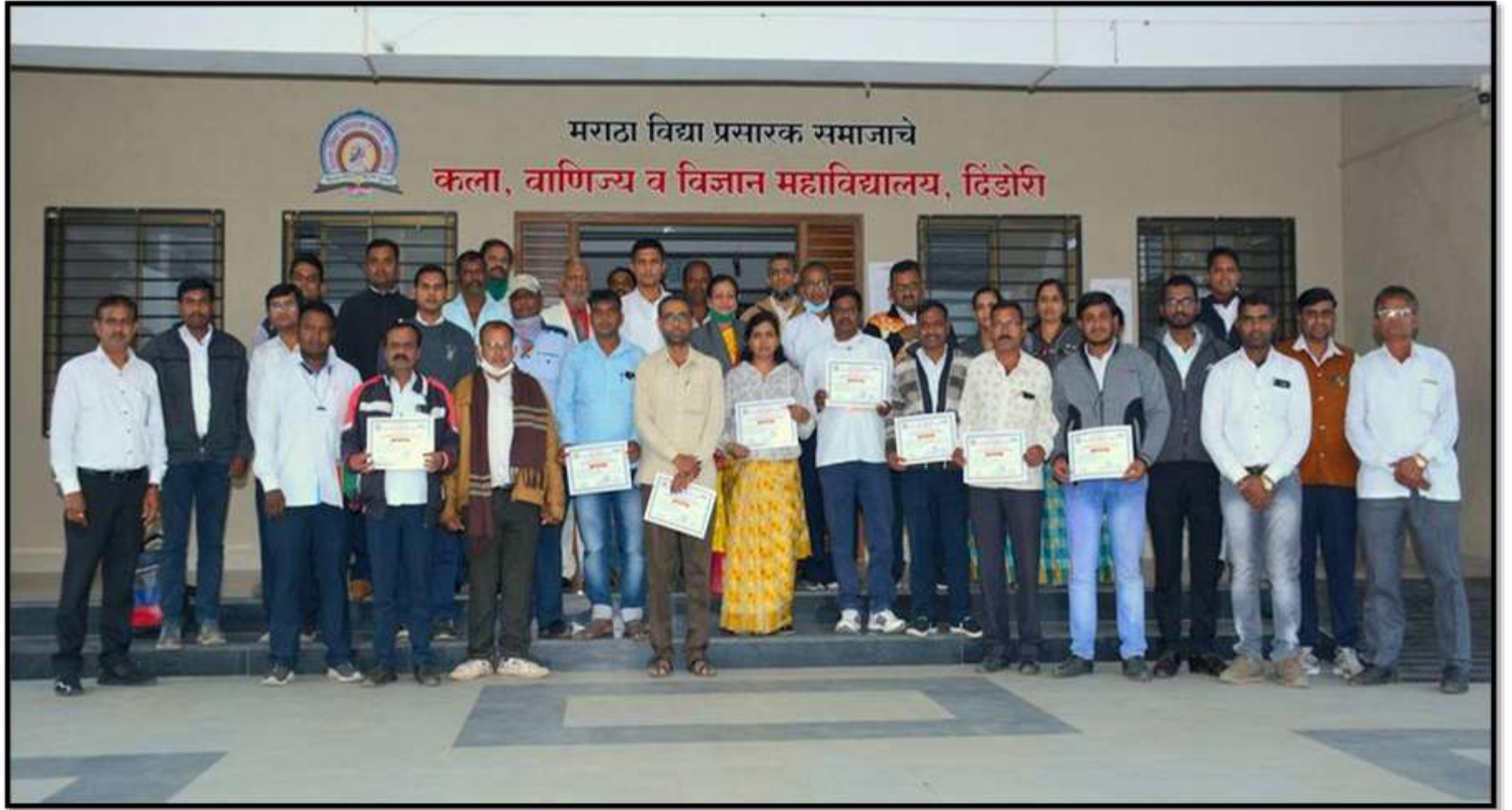
Participant Employees and Organisers of the workshop